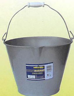
34039 注ぎ口・計量メモリ付 シルバーバケツ8L

材質/本体:PE、つる:鉄 サイズ/300φ×220h 容量/8L 入数/30ヶ 4979404-711507