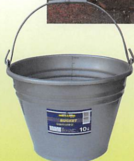
34040 計量メモリ付 シルバーバケツ10L

材質/本体:PE、つる:鉄 サイズ/300φ×220h 容量/8L 入数/30ヶ 4979404-711507