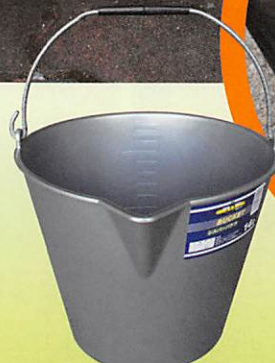
34041 注ぎ口・計量メモリ・手がかり付 シルバーバケツ14L

材質/本体:PE、つる:鉄 サイズ/320φ×250h 容量/10L 入数/30ヶ 4979404-711514